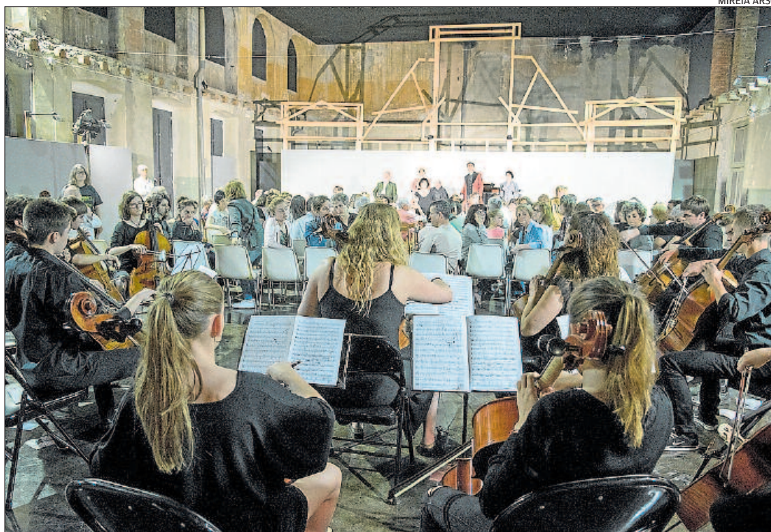
Els violoncel·listes, amb els actors al fons, al tram final del muntatge a l'Espai Memòries del museu

Seguint aquest format es va recordar l'època de la revolució in-