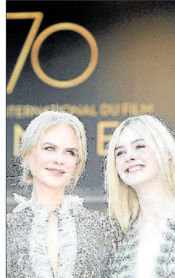
Kidman i Fanning, ahir

El festival ja no convida franquícies, com «Piratas del Caribe», però aposta per films nord-americans de qualitat