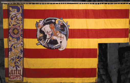
Penó de la Unió Catalanista, 1903

banda per intentar descentralitzar la trobada; d'altra, perquè era la ciutat més gran i més ben comunicada de la Catalunya interior, a més d'haver-hi un important moviment catalanista al voltant de la Lliga Regional. No hi faltaven tampoc motivacions simbòliques com el paper de Manresa en la ràtzia d'Al-mansur al segle X o durant la Guerra del Francès que li va valdre l'apel·latiu de La Cova-donga Catalana.