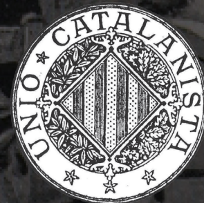
Segell de la Unió Catalanista

Cent vint-i-cinc anys després, en un moment crucial per al nostre país, l'esperit de les Bases de Manresa continua més vigent que mai.