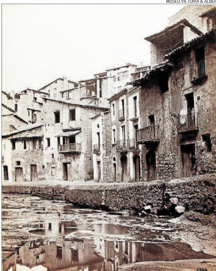
El torrent de Sant Ignasi, un dels més degradats i amb una forta pressió urbana, en una de les imatges més antigues de Manresa

La vida d'aquests treballadors era molt dura perquè cobraven sous molt baixos per fer llargues jornades de treball i només podien treballar en època de feina. Per això, quan hi havia una crisi, era el primer grup que en rebia l'impacte i es veien obligats a viure de l'olla dels pobres que donaven