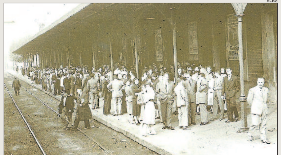
Manresans a l'estació del nord esperant l'arribada de l'Orfeó Català

Aquest interès científic i la seva divulgació es complementava amb l'arxiu municipal, obert l'any 1883 al quart pis de l'ajuntament a càrrec de Leonci Soler March, si bé des de primer del segle i fins al 1935 el veritable ar-