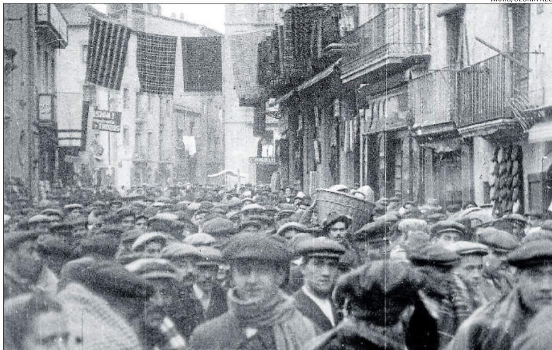
Grup de gent a l'entrada del carrer del Born. Al fons es veu l'entrada al carrer d'Àngel Guimerà i a la dreta l'hotel Sant Domingo, la casa Devant d'Ignasi Oms, cal Riu i cal Tronca, entre d'altres

Però quines van ser les causes que expliquen aquest creixement de població? La població podia augmentar a causa del creixement natural; és a dir, que hi haguessin molts més naixements que defuncions. En aquells anys la natalitat continuava presentant uns valors alts –entre el trenta i el quaranta per mil– ja que les parelles acostumaven a tenir bastants fills, sobretot les famílies pageses